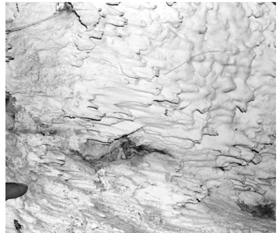
Figure n° 6 : L'extrémité des aiguilles présente un bourgeon en partie recouvert par la calcite.