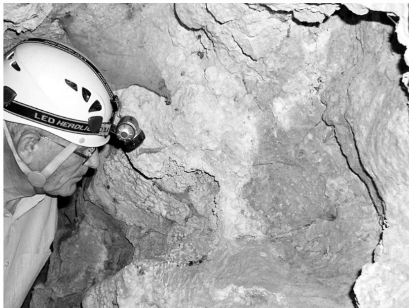
Figure n° 1 : Les parois sont défoncées par une multitude de trous ou concavités qui résultent de la biocorrosion.

En observant de près les parois ( fig. 1 ), j'ai eu la surprise de constater la présence d'aiguilles de calcaire orientées vers l'entrée, c'est-à-dire vers la lumière ( fig. 2 ). Il s'agit de phénomènes de corrosion du calcaire connus sous le nom de phytokarst. Ce phytokarst a d'abord été décrit dans les pays de la zone tropicale, notamment en Chine (Vanara & Maire, 2006), au Laos (Audra, 2007) ou encore à Bornéo.